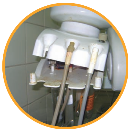
Cuspideira com defeito