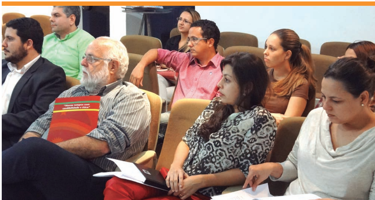
Reunião, na sede do CRO-PE, foi acompanhada por Cirurgiões-Dentistas