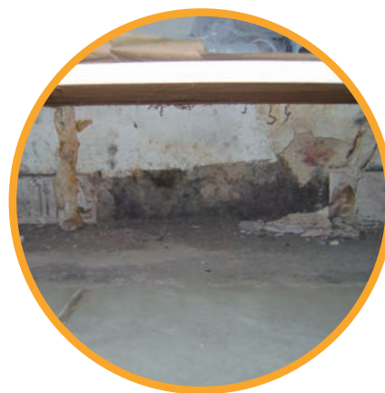
Presença de fungos no corredor

Fiscais do CRO-PE realizaram a interdição ética, no último dia 7 de junho, do Centro de Especialidades Odontológicas - CEO do Cabo de Santo Agostinho, na Região Metropolitana do Recife. A ação foi motivada por denúncias feitas ao Conselho. O prédio, que pertence à Prefeitura do Cabo e está localizado na área central do município, apresentava péssimas condições de funcionamento. A equipe encontrou diversas irregularidades, desde problemas estruturais, como a presença de infiltrações e mofos nas paredes, até equipamentos com defeitos e a inexistência de procedimentos corretos de esterilização do instrumental. Equipamentos quebrados, fiações elétricas expostas, material odontológico acondicionado de forma errada e lixo contaminado (biológico), que apresentavam