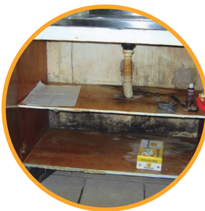
Mofos nas salas clínicas