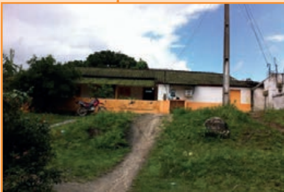
USF Nossa Senhora do Carmo – Unidade de Saúde mais distante do centro de Pombos, aproximadamente 13Km. Assiste parte da população rural do Município.

No mês de julho, a fiscalização do Regional esteve na cidade de Pombos visitando as Unidades de Saúde da Família - USF. Ao todo, foram fiscalizadas as 8 USFs da cidade e um (1) consultório odontológico da Maternidade Virgínia Colaço Dias.