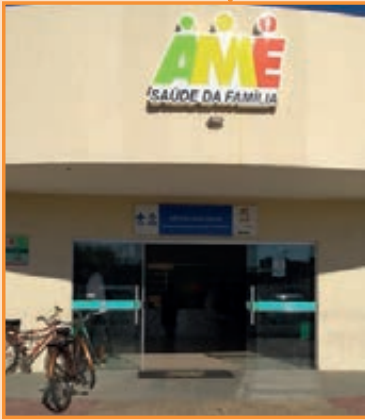
Ambulatório Médico de Especialidades (AME) Roza Maria Ribeiro